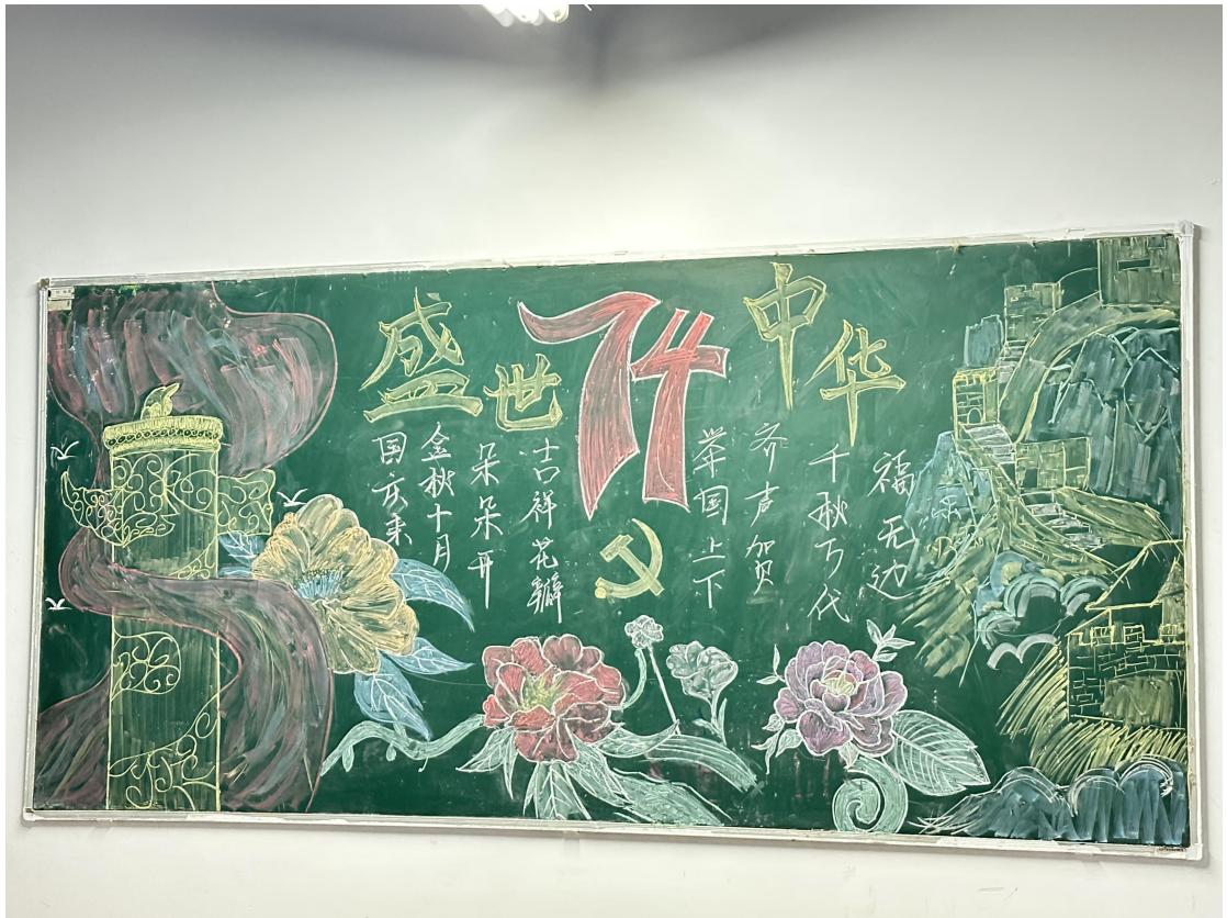
( 国庆主题黑板报作者：视觉传达 韩懿凝；中日舞台 张淼；游戏设计 李好 )